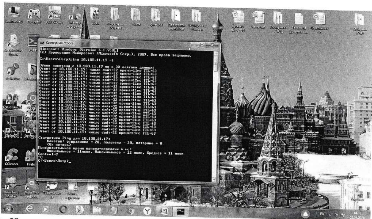
3. Измерение пропускной способности канала передачи данных «от/к» СЗО и времени задержки IP-пакетов